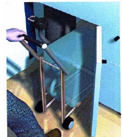
Låger ind til slam