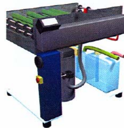
Elektronik og mekanik samlet